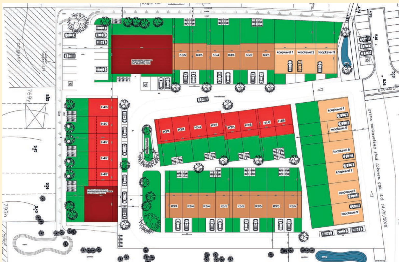
schetsontwerp bij project Heirbrug